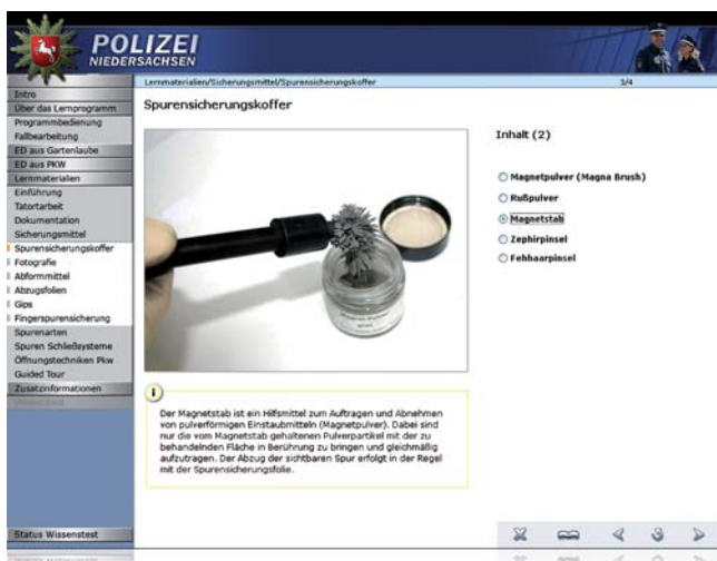
Spurensicherungskoffer | Forensic box

The project is part of the multimedia activities of Niedersachsen and was financed by the federal state's ministry of the interior and sports.